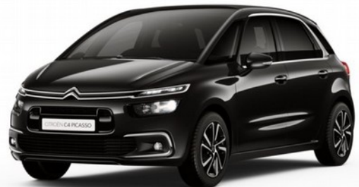
CITROËN C4 BOÎTE AUTOMATIQUE