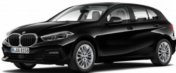
BMW SÉRIE 1 BOÎTE MANUELLE

Un véhicule de catégorie B, fiche de suivi, livret d'apprentissage, cahier pédagogique, documents divers.